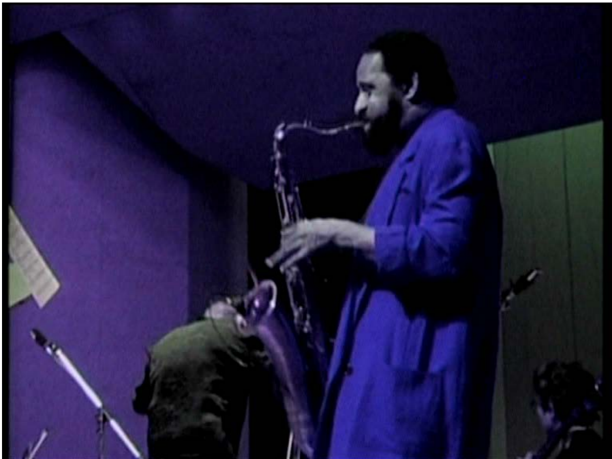
Sonny Rollins während der Uraufführung in Tokio

Es folgen dann fast vierzig Minuten des Konzertes für Tenor-Saxophon und Orchester. Gemischt werden die Konzertaufnahmen mit Bildern vom täglichen Leben in Japan. Für mich persönlich ist die Mischung von sinfonischer Musik mit dem Jazz eine Enttäuschung. Hier wird versucht, Welten zu mischen, die meiner Meinung nach nicht unbedingt zusammengehören. Mir ist jedes sinfonisches Konzert und jedes Jazz-Konzert in getrennter Form wesentlich lieber. Buchen wir das Konzert unter Experiment. Ich hoffe, dass mir die Jazzfreunde und Klassik-Freunde verzeihen.