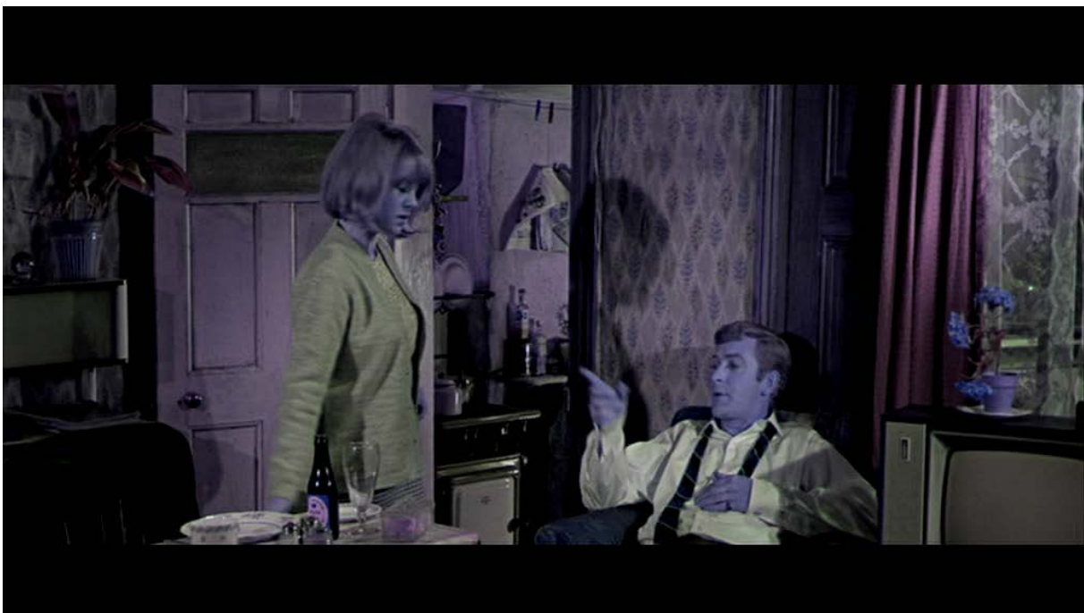
Gilda (Julia Foster) und Alfie (Michael Caine)

Film-Inhalt: London, Swinging Sixties. Drei Hunde, die herumstreunen, vergnügen sich in den Docks von London beim Liebesspiel. Dann laufen sie zu einem Auto in der ein Mann (Alfie = Michael Caine ) und eine Frau (Siddie = Millicent Martin ) ein Schäferstündchen haben. Als dieses beendet ist, stellt sich Alfie dem Kinopublikum in einer direkten Ansprache von der Leinwand her vor. Alfie erklärt dem Publikum die Vorzüge einer verheirateten Geliebten und wie man dann diese elegant fallenlassen kann. Er hat ein überschäumendes Verlangen nach dem weiblichen Geschlecht. Der Herzensbrecher besucht dann eine weitere Flamme namens Gilda ( Julia Foster ). Diese hat einen Busschaffner als Verehrer, den sie aber langweilig findet und den sie nicht erhört. Ihr Herz hängt an dem Verführer und Luftikus Alfie. Dieser erklärt dem staunenden Publikum die Vorzüge und Nachteile seiner Geliebten. Zu der Musik ( Alfies Theme ) des Saxophonisten Sonny Rollins, im typischen Jazz-Sound der sechziger Jahre, fährt der Playboy bei seiner Geliebten Gilda vor, um zunächst einmal bei ihr ein Essen zu schnorren, bevor er sich mit ihr ins Bett begibt. In typischer Macho-Manier umgarnt er Gilda. Für Alfie ist es wichtig, dass er Spaß hat und emotionale Bindungen vermeidet.