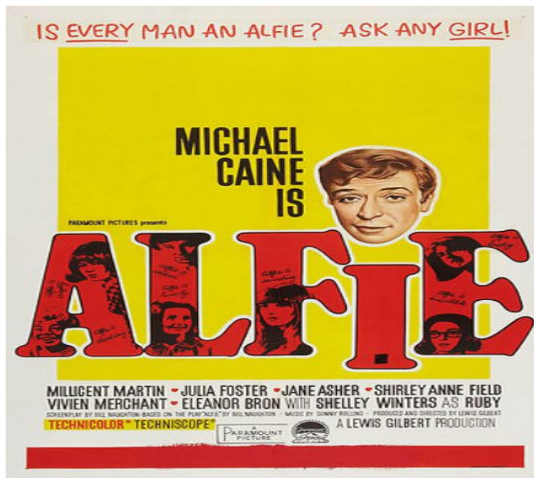
Englisches Filmplakat zu „Alfie“